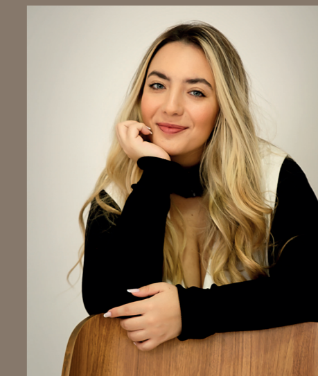
Renderização e 3D Daphne Catani XYZ Render