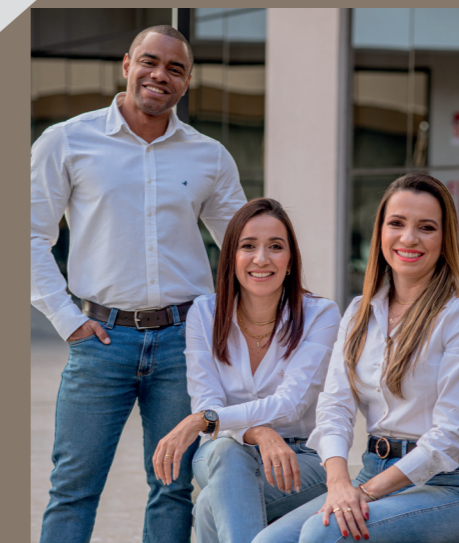
Projeto arquitetônico e fachada Do Seu Jeitim Engenharia e Interiores