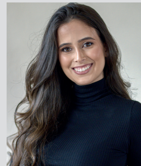
Arquitetura e design de interiores Marília Caetano Arquitetura e Interiores